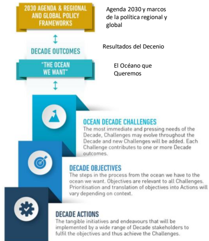
Figure 2.1. Decade Action Framework

Iniciativas tangibles que se implementarán por las partes interesadas para cumplir los objetivos y alcanzar los desafíos.