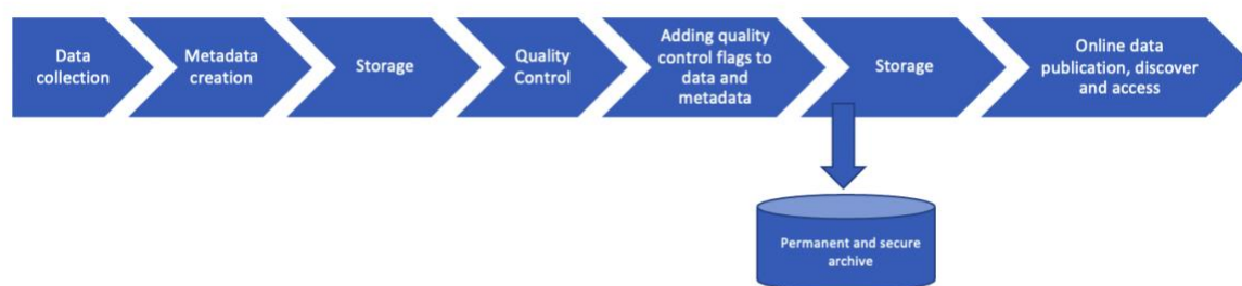
Figure 2: Diagramme de flux de données pour les données en mode différé

L'importance d'une gestion professionnelle et de qualité des données et des informations peut être illustrée comme suit (figure 2) (exemple)