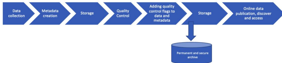
Figura 2: Diagrama de flujo de datos en modo diferido

La importancia de una gestión profesional y de alta calidad de los datos y la información puede ilustrarse de la siguiente manera (Figura 2) (ejemplo):