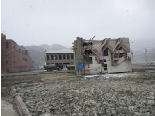
The tsunami in Japan in 2011 caused extensive damage and loss of life.

She stressed that it was that level of cooperation at the regional level that started the establishment of an early warning system. "We have been doing that over the last six years - developing these regional networks so that we are able to detect in less than one minute the advent of an earthquake in the Caribbean," she added.