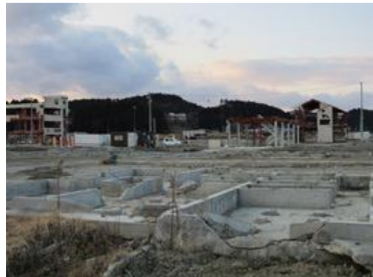
Only the foundation of this structure was left following the earthquake and tsunami in Japan.

She added the "trick" was now to take the public education programme to the next level - what to do after the warning was received, and how to respond appropriately depending on where you are. "You may have parents or a housewife sitting at home and their children are at school [when the warning is received]. Do you decide I must get to my child even though the children may be safe in school because the teachers know what to do and they take the children to safety? These are some of the strong [educational] messages that a national public education programme would want to develop," she said.